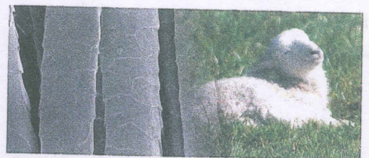
拡大図：使用羊毛表面